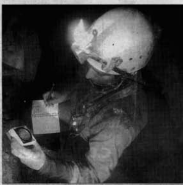
APUNTES. Un espeleólogo hace el estudio topográfico.