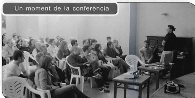
Un moment de la conferència