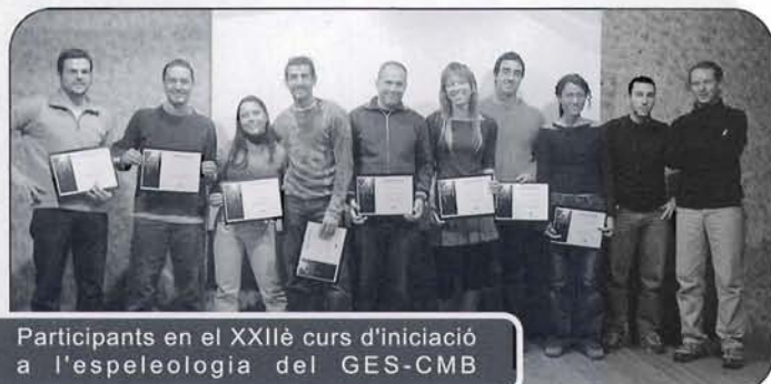
Participants in the XXII course of initiation to speleology of the GES-CMB