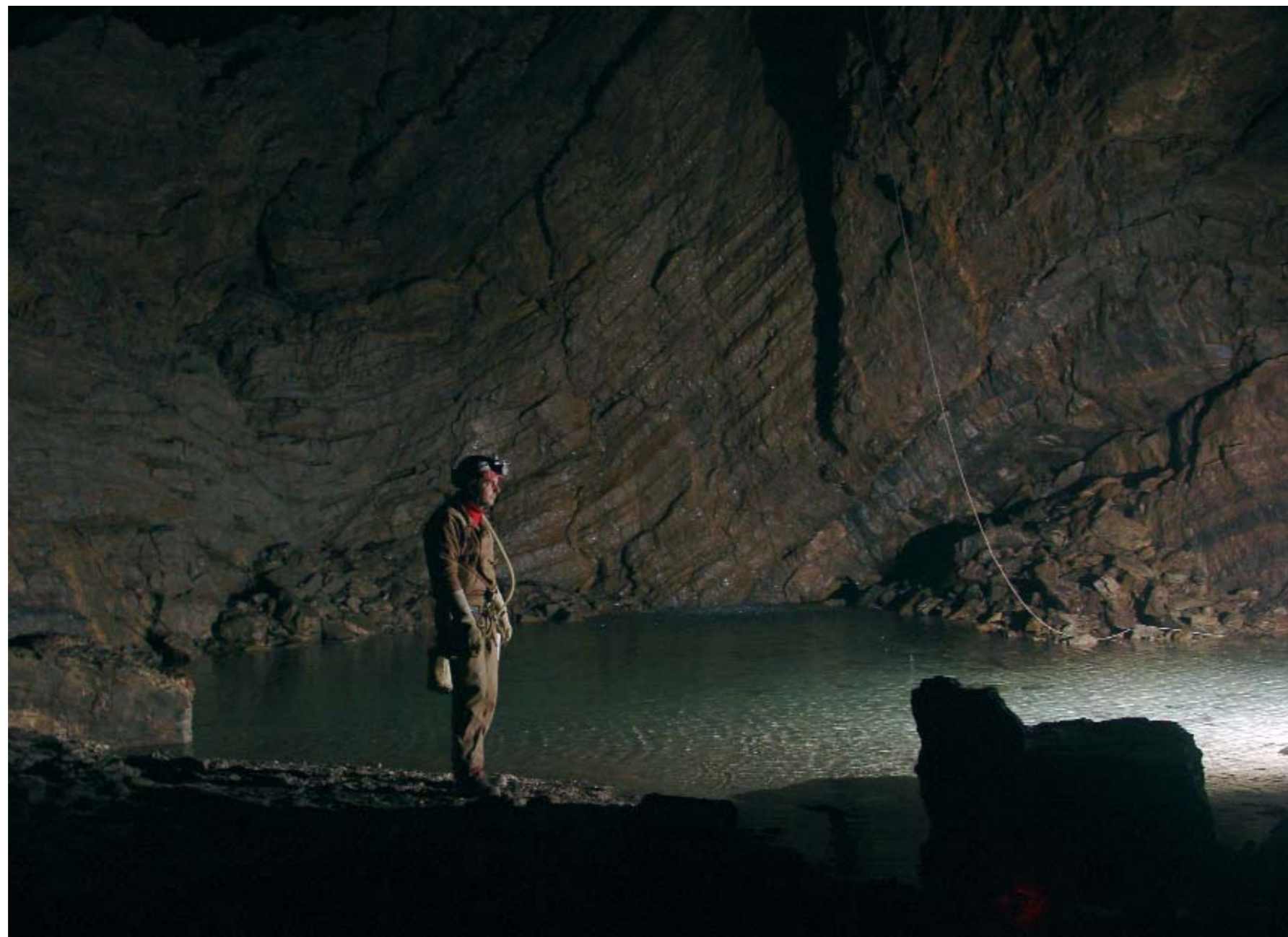
Avenc Krúbera-Voronya. Sala dels Espeleòlegs soviètics.

Tots teníem al cap l'absoluta certesa que aquesta era justament la via que ens duria finalment a superar els dos quilòmetres de profunditat. En aquells moments hi ha tanta eufòria que no sents el fred, la fam ni el cansament. Simplement, continues baixant, segueixes explorant